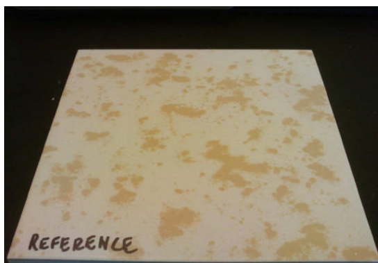
Původní - nová dlaždice