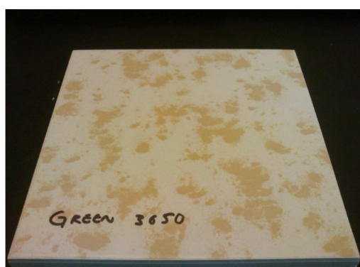
Twister zelený po 3650 cyklech