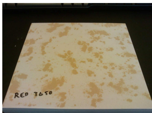
Twister červený po 3650 cyklech