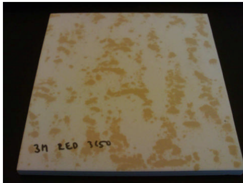
3M červený po 3650 cyklech