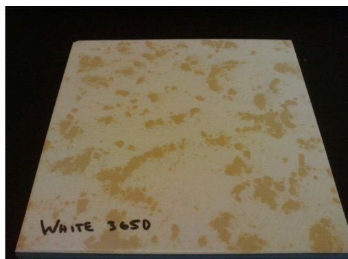
Twister bílý po 3650 cyklech